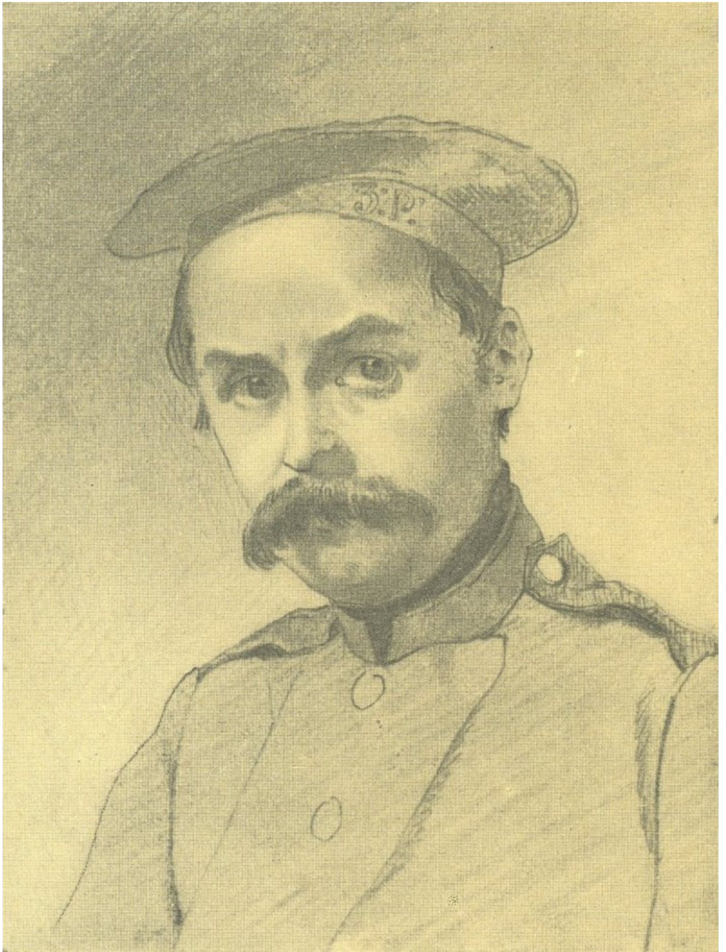
Автопортрет. Олівець, 1847 р.