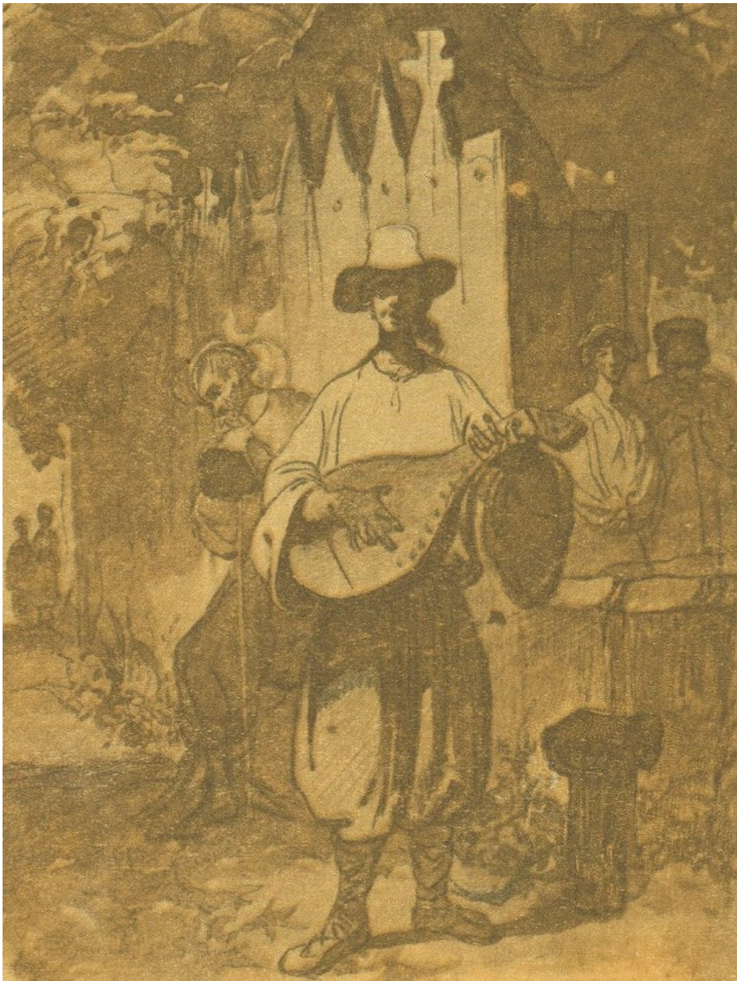
Сліпий (“Невольник”) Сепія, 1843 р.