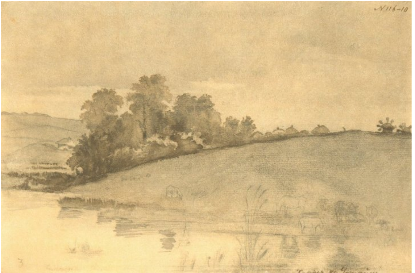
Хутір на Україні. Олівець, акварель 1846 р.