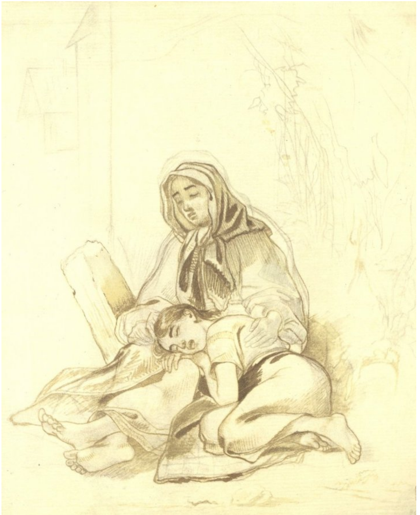
Сліпа з дочкою. Олівець, сепія 1842 р.