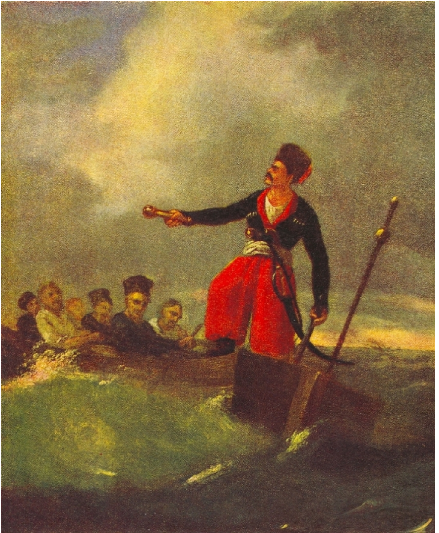
Гамалія. Олія, 1842 р.