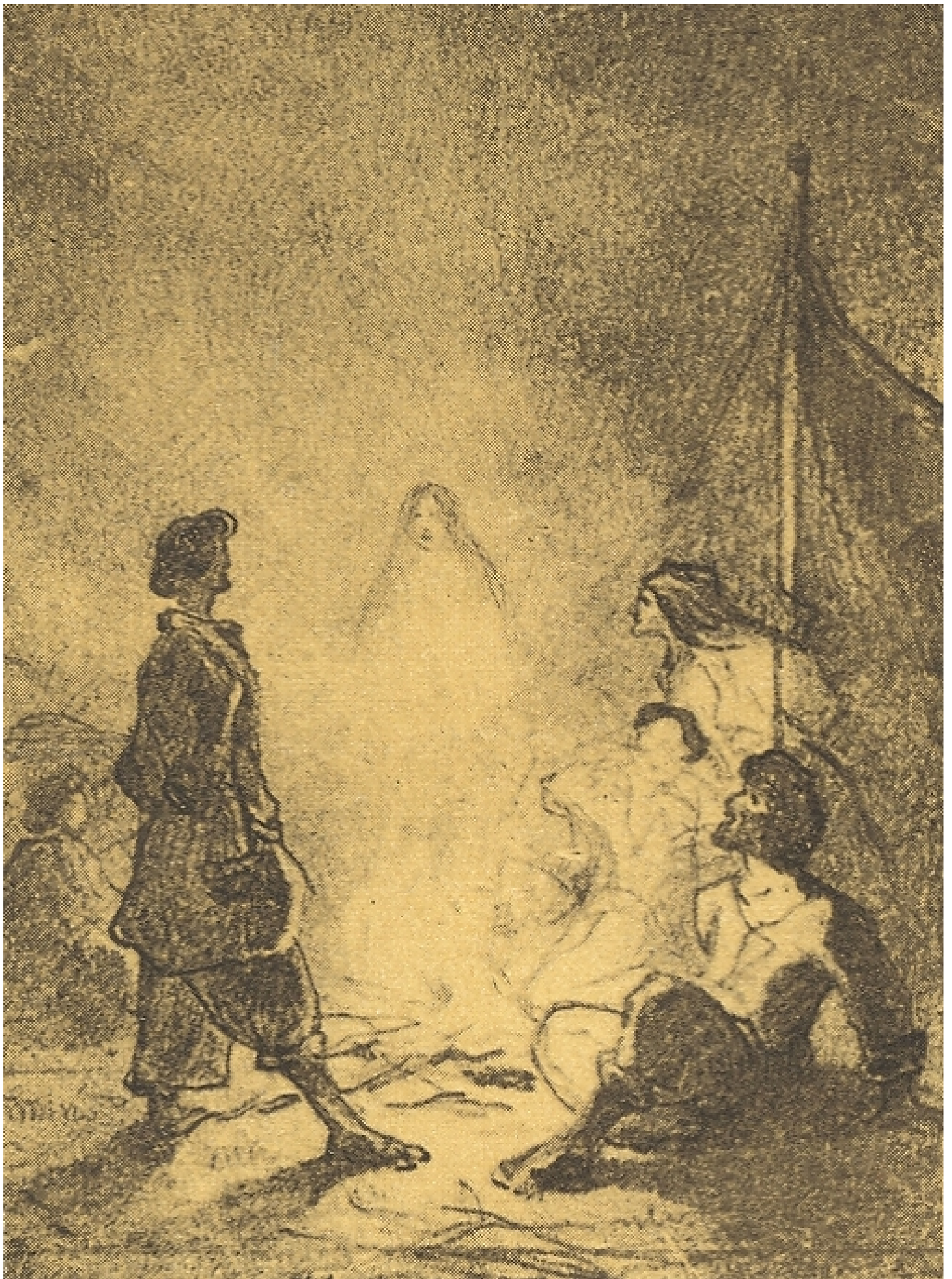
Відьма. Олівець, 1847 р.